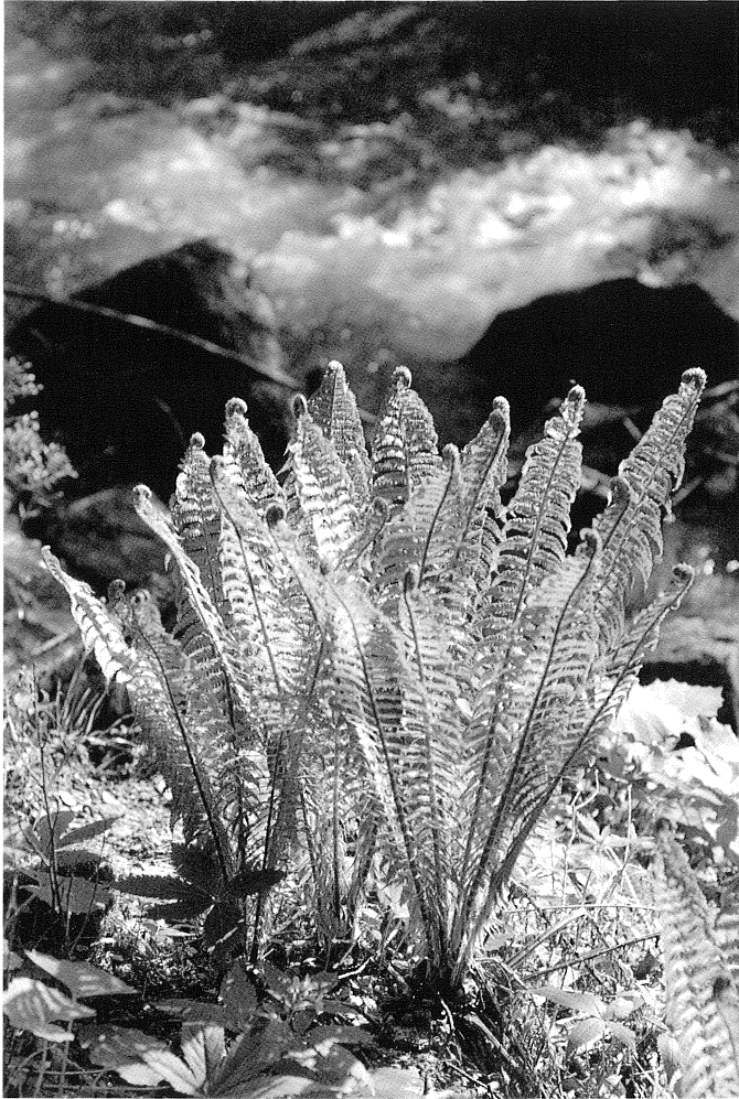
Fig. 1 - Matteuccia struthiopteris (L.) Tod. in Valle della Cavallina, quota 700 m (maggio 1988).

Comune di Vione, Valle di Vallaro, in più punti del fondovalle tra m 1450 della località Paghera e m 1550, UTM 32TPS100200; UTM 32TPS110200.