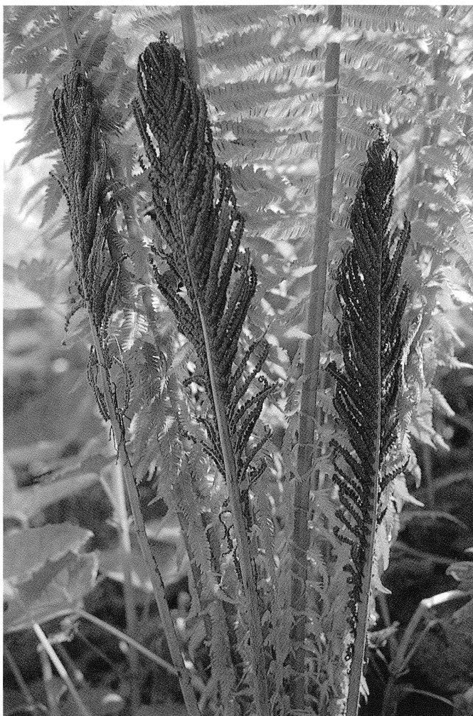
Fig. 2 - Matteuccia struthiopteris (L.) Tod. in Valle della Cavallina, quota 700 m (maggio, 1988).

Comune di Collio, Valle Torgola, nelle radure del bosco misto presso la riva del torrente a m 900 ca. e nel fondovalle a m 750 ca., UTM 32TPR740730.