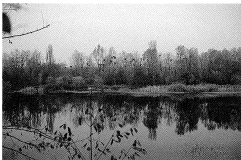
Fig. 1 - Veduta invernale della colonia di Airone cenerino Ardea cinerea all'interno del raccordo autostradale di Brescia centro.

Un individuo parzialmente melanico osservato il 13 e 14 dicembre con altri 146 congeneri presso un allevamento ittico in comune di Calvisano. Il soggetto poco tollerato dagli altri, si manteneva sempre ai margini del gruppo (Gargioni A.).