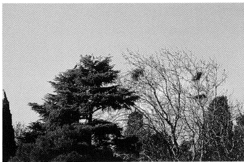
Fig. 2 - Veduta dei nidi della piccola colonia di Ardea cinerea sull'isola di Garda.