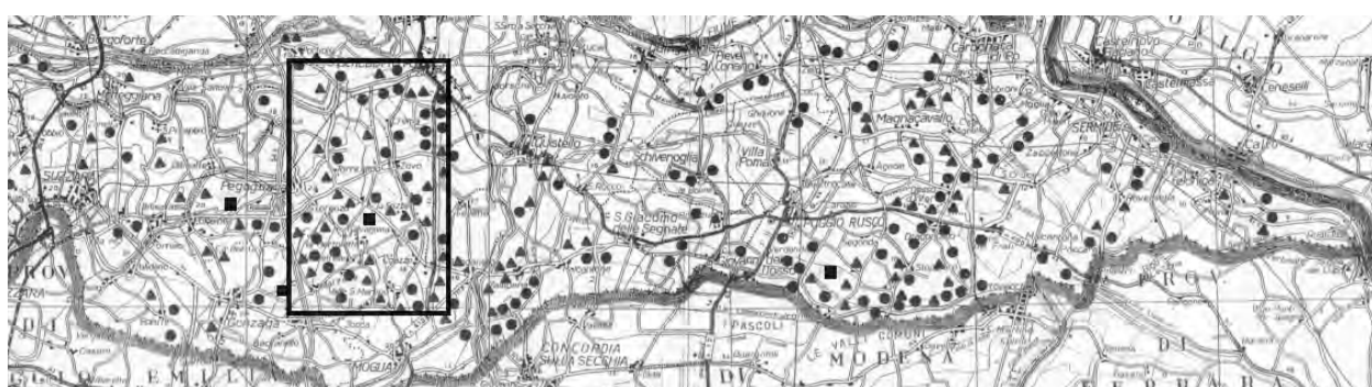
Fig. 3 – Distribuzione invernale di Albanella reale (■), Poiana (●) e Gheppio (▲) nel periodo 1999/00.

suddiviso il numero di individui osservati per i chilometri di lunghezza della retta. In modo analogo per l'area di massima concentrazione, per le quali abbiamo utilizzato il lato maggiore del rettangolo come valore per il calcolo degli individui per km/lineare. Viene calcolata anche la media di individui per km 2 sull'intera area censita e sull'area di massima concentrazione nei due periodi.