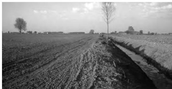
Fig. 1 – Paesaggio tipico della bassa pianura mantovana.

dui sono stati conteggiati dall'automobile ad una distanza massima di circa 500 metri. Nel corso dei due periodi sono stati percorsi gli stessi itinerari per un totale di 1050 km. L'unità cartografica di riferimento utilizzata è stata la Carta Stradale I.F.B. di Bologna della Provincia di Mantova 1:100.000. Per ogni cartina viene disegnato un rettangolo ad indicare la zona di massima concentrazione, che per l'anno 1998/1999 è di 47 km 2 (8.5 km il suo lato maggiore) e per l'anno 1999/2000 di 65 km 2 (10 km il suo lato maggiore).