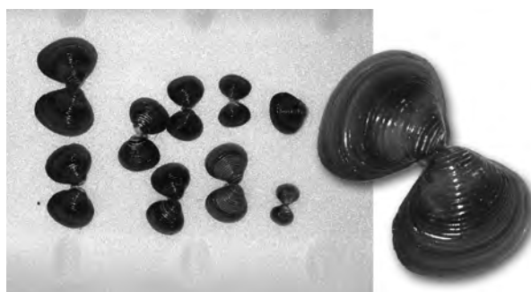
Fig. 1 - Esemplari di Corbicula fluminea (O. F. Müller, 1774).

In Italia le prime segnalazioni della specie, sconosciuta fino al 1995 (BEDULLI et al. , 1995) sono riferite ad ambienti di acque correnti, ed in particolare nel corso principale del medio-basso Po e nei rami deltizi del Po di Goro, di Venezia e della Donzella (FABBRI & LANDI, 1999; MALAVASI et al. , 1999). La specie era stata già segnalata anche nel bacino meridionale del lago di Garda in Provincia di Brescia nella zona di Malerba del Garda (NARDI & BRACCIA, 2004). Un ulteriore rinvenimento casuale per il Lago di Garda ha rilevato la sua presenza ancora nel basso lago nel territorio del comune di Peschiera del Garda (VR). A seguito di una burrasca nell’aprile 2003 si è infatti verificato il trasporto sulle rive del lago di una abbondante quantità di detrito, sul quale sono stati osservati molti individui di Corbicula (Fig. 1).