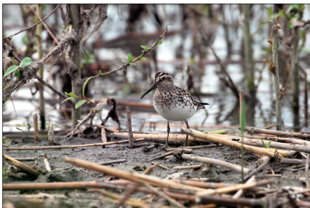
Fig. 1 - Gambecchio frullino Calidris falcinellus . Individuo fotografato l'8 maggio a Lugana di Sirmione.