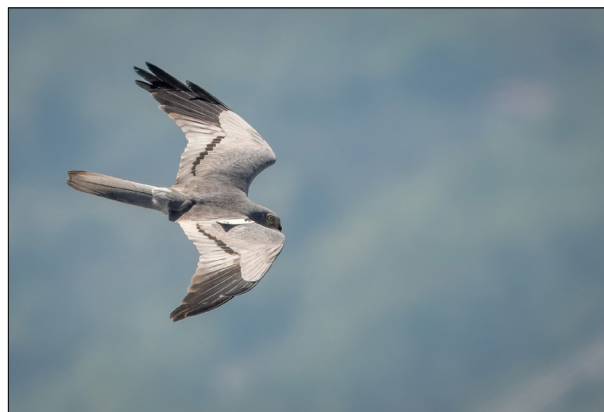
Fig. 4 - Albanella minore Circus pygargus . Maschio con marcatura alare di origine tedesca fotografato il 14 aprile a Cima Còmer.