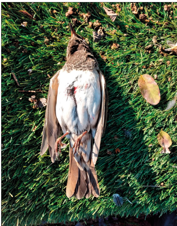
Fig. 6 - Tordo golanera Turdus atrogularis . Esemplare raccolto il 10 novembre nel comune di Lonato (Foto di anonimo tramite M. Caffi).