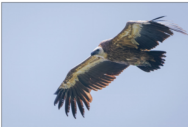
Fig. 3 - Grifone Gyps fulvus . Individuo di origine croata fotografato il 23 maggio a Cima Còmer.