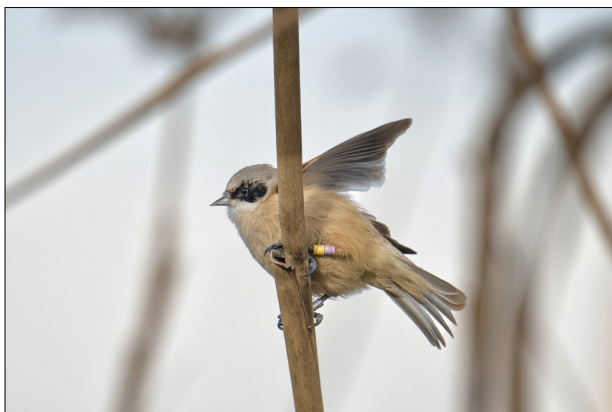
Fig. 5 - Pendolino Remiz pendulinus . Individuo inanellato in Svezia, fotografato il 22 gennaio sul basso Lago di Garda.